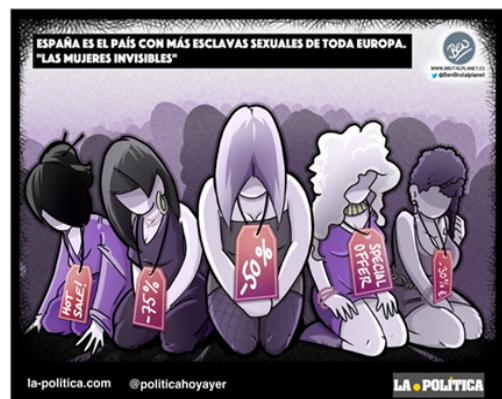
Egilea: Ben - @BenBrutalplanet / Iturria: la-politica.com

Sistema hau ikuspuntu orokorretik hartu ezker, erraz jabetu gaitezke prostituzinoaren, sexu-esplotazioaren eta personen salerosketaren arteko lotura eztabaidaezinaz: prostituzino-sistema emakumezkoen salerosketatik elikatzen da (lehengaia jadestearen haritik) sexu-esplotazioa helburutzat hartuta, bizirik irauteko eta prostituzinoaren eskariari eran-tzuteko. Sistema honek emaku-mearen gorputza eskuratzeko eta merkataritza-gai bihurtzeko sexu-eskubidea bermatzen dau. Hona, horren zantzu nabar-menak: eskatzaile gehienak gizonak dira; prostituitutako pertsona gehienak emakumeak dira (asko eta asko erabateko ahulezian dago) eta jarduera honek egundoko irabazia eragiten dau.