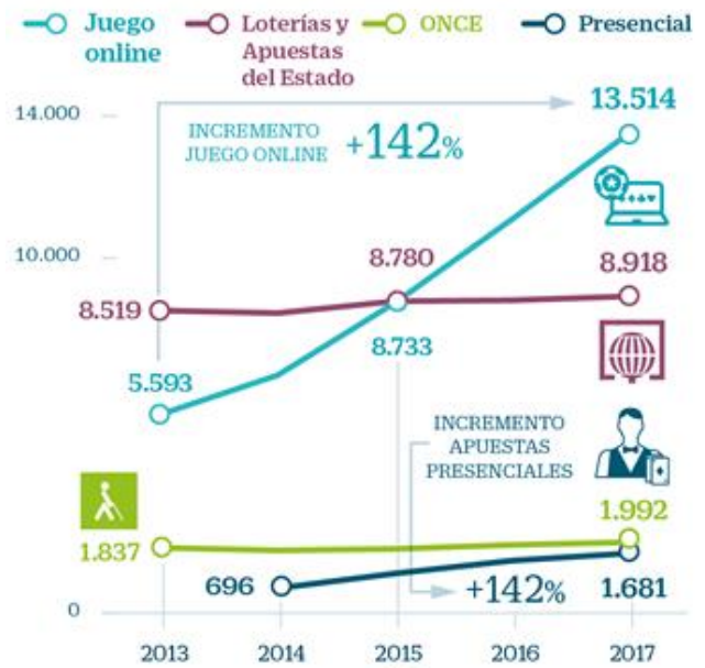
Cantidades jugadas En millones de euros

Batez be egoera bik eragin dabe azken urteetako gorakada hau: alde batetik, on-line egiten diran zorizko jokoen legalizatzea ekarri eban Jokoaren Ordenamenturako 13/2011 Legea indarrean sartzea. Honen ondorioz, zuzeneko joko-eskaintzak be gora egin eban nahitaez, bere mailari eutsi ahal izateko, joko-areto gehiago zabalduz eta taberna eta abarretan apustuak egiteko makina gehiago jarriz (2.100etik gora Euskal Herrian). Beste alde batetik, gero eta hedatuago dagozan teknologia barriek eta sareek zuzeneko apustuetan nekez lortu daitezkean prestasun, eskuragarritasun eta arintasuna emoten deusez on-line jokolari. Zerbaitegatik, apustuak on-line egiten dabezan personeren kopuruaren igoera ikaragarria izan da: estaduan, erabiltzaile aktiboen